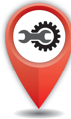
Schnelle Hilfe am Waggon

Die Nutzung von RAILconnect ist exklusiv für CRSC-Mitglieder vorbehalten.